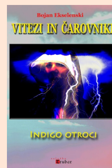
Naslovnica Indigo otrok

Pozdravljeni Indigo otroci je odlična knjiga Zelo me je navdušila in še bolj sem vesela da se je tudi kakšen slovenski avtor lotil takšne vrste del Vse pohvale le tako naprej - komaj čakam na nadaljevanja Lp Sara