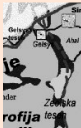
Območje dogajanja v zgodbi Junaški boj Zeolije

V zgodbi, ki bo objavljena sredi marca, je opisan ta junaški boj.