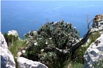
Naš svet je iz goste materije

Sehir bar Jemin, kratko imenovana Knjiga, je skrivnostno vilinsko delo, pravzaprav posebna knjiga urokov. Nihče ne ve natančno, kdaj se je ta