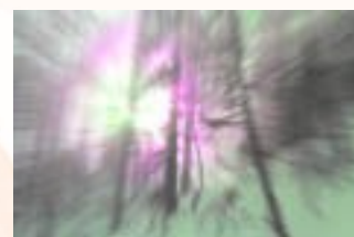
Očisti si um in začutil boš tišino ravnotežja.

Seveda ste vabljeni na uradni portal projekta http://vitezicarovniki.com .