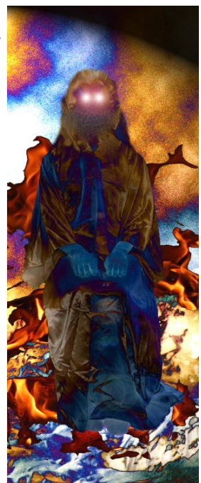
Prestol basilea v Medsvetu.

»Predstavitve po Sloveniji so nujne zaradi promocije žanrskega prvenca.«